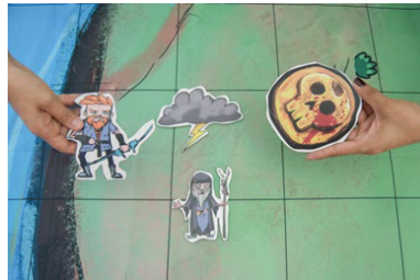
Marathon Cards® App